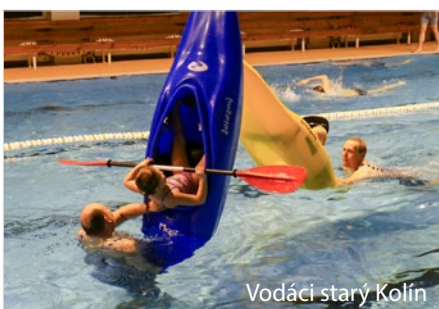
Vodáci starý Kolín

Nadšenci leteckých modelů se letos v létě mohou těšit na vrcholnou akci na území České republiky. V Jeseníku-Mikulovicích se od 6. do 13. srpna uskuteční Mistrovství světa leteckých modelářů v kategorii F3B. Zároveň pro rádiem řízené rychlostní větroně připraví Svaz modelářů ČR a RC MK Brno.