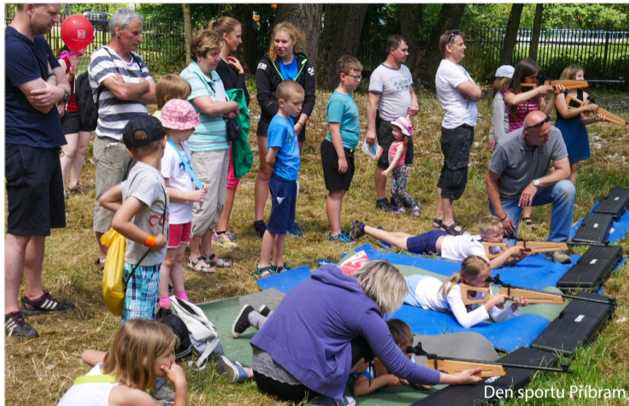
Den sportu Příbram

Ano, jednou ze zásadních podmínek přidělení finančního příspěvku na realizaci projektu byla míra zapojení veřejnosti. Některé kluby pořádají akce pro veřejnost jaksí samozřejmě, některé to dělají poprvé v rámci projektu, který zároveň slouží klubům i k získávání no-