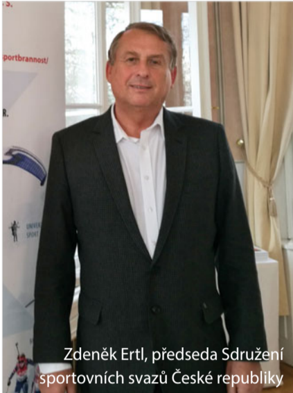
Zdeněk Ertl, předseda Sdružení sportovních svazů České republiky