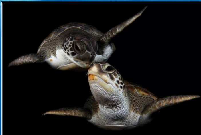
Cena Svazu potápěčů / Cena diváka za fotografii / Grillo Montse (Španělsko)

světa. V této kategorii soutěží několik stovek dětí z celé republiky. Pro dětské návštěvníky festivalu vyhlásili organizátoři ještě speciální soutěž „Namaluj vystavenou fotografii“. Někteří soutěžící se do malování vrhli s opravdovým zápletem. (viz foto).