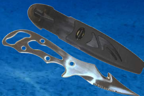
Text: Miloslav Haták

Určitou zajímavostí je fakt, že ve většině zemí na světě bez problémů koupíte například kuchyňský nůž, u kterého nikdo většinou neřeší délku čepel. Statisticky je ovšem dokázáno, že právě tyto nože figurují nejčastěji při ublížení na zdraví, pokusech o vraždu nebo vraždách spáchaných noži.