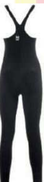
Evo+ pro muže