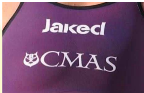
JAKED CMAS J12 (před 1. lednem 2016)